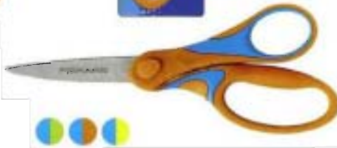
9464 Tijeras para Escolares 16 cm - puntiagudas