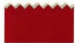
9814 Kidzors™ - Cocodrilo