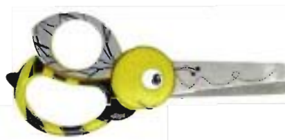
1379 Tijeras Animal para niños - Abeja