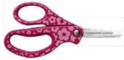
4169 Tijeras para niños edición especial 14 cm • Mango decorado