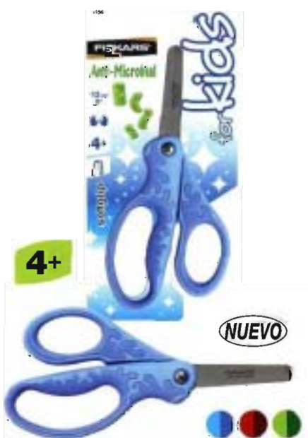
4156 Tijeras Niños Anti-Bacterias Softgrip® 13 cm • Mango con tratamiento anti-bacterias con acción de limpieza continua, evitando el crecimiento de las bacterias • Mango curvado en materia SoftGrip® antideslizante para más comodidad • Para diestros y zurdos