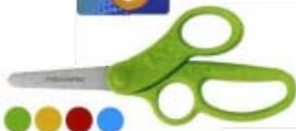
9468 Tijeras para niños Control total 13 cm - redondeadas