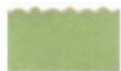
3033 Kidzors™ - Cerdo