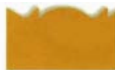
3018 Kidzors™ - Ballena