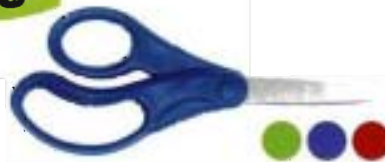
89055 Tijeras SchoolWorks™ para niños 13 cm - redondeadas