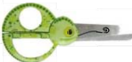
1376 Tijeras Animal para niños - Camaleón