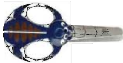
1377 Tijeras Animal para niños - Araña