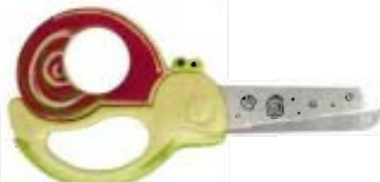
1374 Tijeras Animal para niños - Caracol