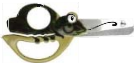
1375 Tijeras Animal para niños - Rana