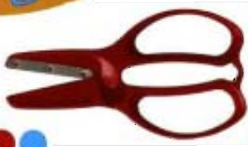
9390 Tijeras preescolares con autoapertura 11 cm - redondeadas