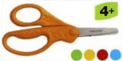
9416 Tijeras para niños 13 cm redondeadas