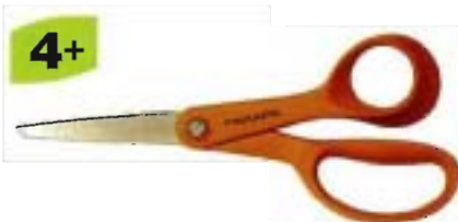
9992 Tijeras para niños Classic 14 cm - redondeadas • Para diestros