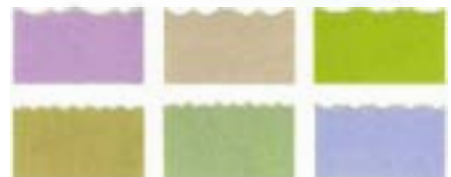
0443 Set Kidzors - x 6