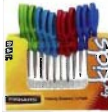
19416 Tijeras para niños (paquete de 12) • 12 x 9416 - puntas redondeadas • Conjunto de colores