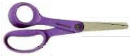
9993 Tijeras para niños zurdos Classic 14 cm - redondeadas • Verdaderas tijeras para zurdos: el mango y las hojas son diseñados para zurdos para mejorar la visibilidad y la comodidad durante el corte