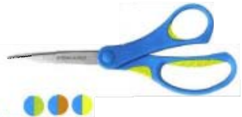
9970 Tijeras para Escolares Softgrip® 18 cm - puntiagudas • Mango Softgrip® para mejor control y toma en mano