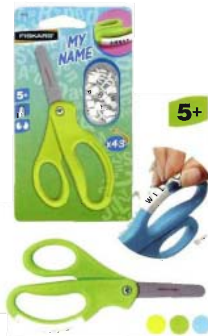
9835 Tijeras para niños My Name 13 cm - redondeadas • ¡Ya no perderá o confundirá las tijeras! • Suministrada con elementos que permitirán a los niños personalizar sus tijeras