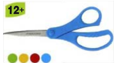
9458 Tijeras para Escolares 18 cm puntiagudas