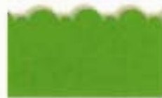
9812 Kidzors™ - Mariquita