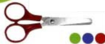
8801 Tijeras SchoolWorks™ para niños con anillos simétricos 11 cm - redondeadas