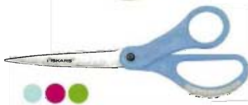
9838 Tijeras personalizables Uso general 21cm - puntiagudas • ¡Ya no perderá o confundirá las tijeras! • Suministradas con elementos para personalizar las tijeras