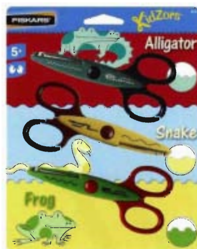
8231 Kidzors Animales rastros x 3