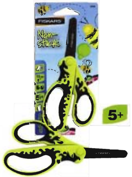
9398S Tijeras para niños antiadhesivas 13 cm - redondeadas • Hojas con revestimiento antiadhesivo para impedir que los adhesivos como cintas, etiquetas, Velcro®... se peguen a las hojas • Muy fácil de limpiar las hojas con un trapo húmedo • Mango Softgrip® para una toma en mano y sujeción mejorada