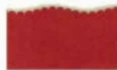
9813 Kidzors™ - Gusano