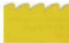
3017 Kidzors™ - Tiburón