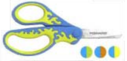
9422 Tijeras para niños Softgrip® 13 cm - redondeadas • Mango Softgrip® para una toma en mano y sujeción mejorada