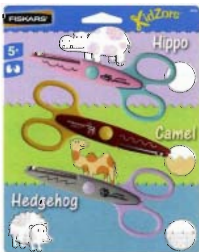
8233 Kidzors Animales del zoo x 3