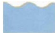
9815 Kidzors™ - Serpiente