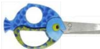
1378 Tijeras Animal para niños - Pez