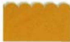
9811 Kidzors™ - Oruga